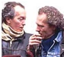
Jean-Pierre et Luc Dardenne